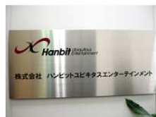
韓ハンビット ユビキタスエンターテインメント OSチーム様

「nProtect」を利用して頂いているおかげでBotなどの数は非常に少なく、サービスの向上にとても役立っております。